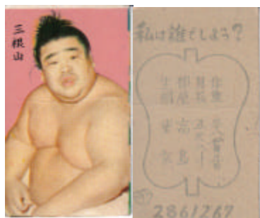
#6: Une coupe des mauvais jours 1957 Yamakatsu Dai Gunbai 6-7