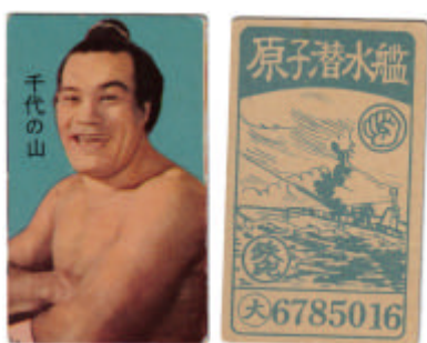
#2: Le 1 % 1959 Maruo Uchu 7

#1 : Quelle meilleure façon de se concentrer qu'avec un manga japonais ? Et est-ce que Wakamisugi donne le sentiment qu'il veut botter les fesses d'un journaliste ?