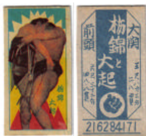
#11: Vraiment ? 1954 Rokakuke 8-9