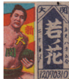
#10: Une pastèque, quelqu'un ? 1956 Tsuriyane 7-8-9