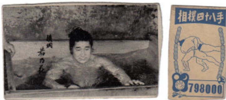
#3: L'heure du bain 1958 Marukami Kimarite Bromide 6

#6 : On dirait qu'il y a des photographes partout.