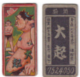
#12: Une caricature qui tourne mal 1954 Caricature 7