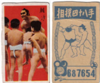
#4: Les enfants seront toujours des enfants 1958 Marukami Kimarite 6