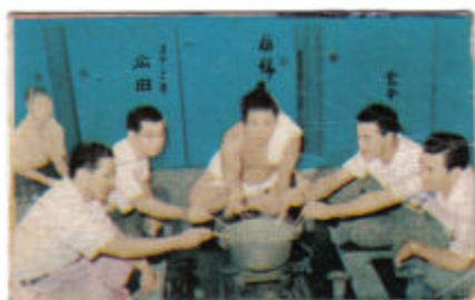
#9: La marmite de chanko-nabe 1957 Marukami Sensou 6