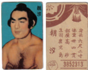
#5: Le manteau de fourrure 1958 Doyusha Kiku 7