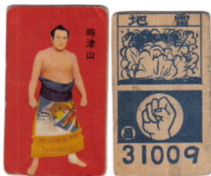
Figura 4 (BC574-3) – Maegashira Tokitsuyama - 1957 Marushou Sensou 5: Tipo 3

El último grupo de la serie BB utilizado para jugar menko fue