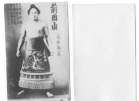
Figura 2 (sobre 1946) – Bromuro no catalogado en Blanco y Negro de Maedayama como Ozeki

En la década de 1940 aparecieron la mayoría de los conjuntos impresos de cartas de bromuro de plata de la serie BB y probablemente hubo más de 50 juegos diferentes realizados durante esa década. Aunque no son muy difíciles de encontrar, son muy difíciles de catalogar debido a la falta de impresión en el reverso de la tarjeta y a que tienen muy pocas señas de identidad en el anverso. Las cartas típicas de bromuro de plata de la serie BB tienen el shikona de los rikishi al frente junto a otras diversas estadísticas, como lugar de nacimiento, altura, peso, heya y técnica favorita. A continuación se muestra una carta de bromuro de plata de la serie BB de alrededor de 1946 con el futuro Yokozuna Maedayama.