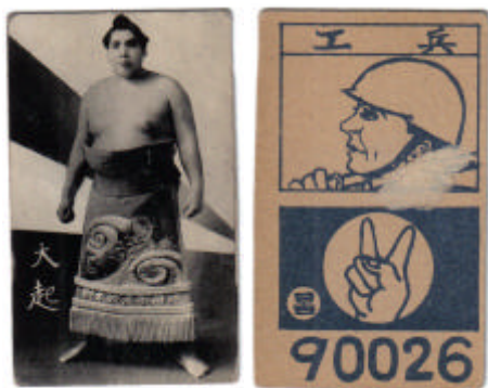
Figura 3 (BB574-1) – Maegashira Otachi - 1957 Marushou Sensou Bromuro 5: Tipo 1

de la serie BB impresas a medias tintas fueron diseñadas para ser utilizadas en los juegos de menko y la mayoría sólo tienen el shikona del rikishi al frente. Además, los menko serie BB de la década de 1950 por lo general tienen en contrapartida un conjunto de colores de bromuro, o una serie BC, que comparten el mismo diseño de atrás y era impreso al mismo tiempo (ver fotos 3 y 4). Probablemente era más barato diseñar e imprimir cartas con el mismo reverso en vez de dos diferentes para cada una de las series.