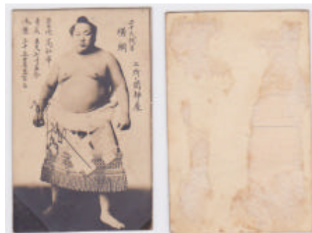
Figura 1 (Set BB381) – Yokozuna Tamanishiki – Mini Bromuro de 1938

Las cartas serie BB de la década de 1930 son difíciles de encontrar. Muchos de estos menko fueron destruidos en la guerra o reutilizados como papel para apoyar el esfuerzo de guerra japonés. Sin embargo existen algunos grupos, como el Mini Set Bromuro de 1938 (BB381). (Ver Figura 1). Sólo hay dos tarjetas confirmadas en esta serie y muchas cartas probablemente no sobrevivieron debido a su pequeño tamaño, que es de 1 "x 1,75".