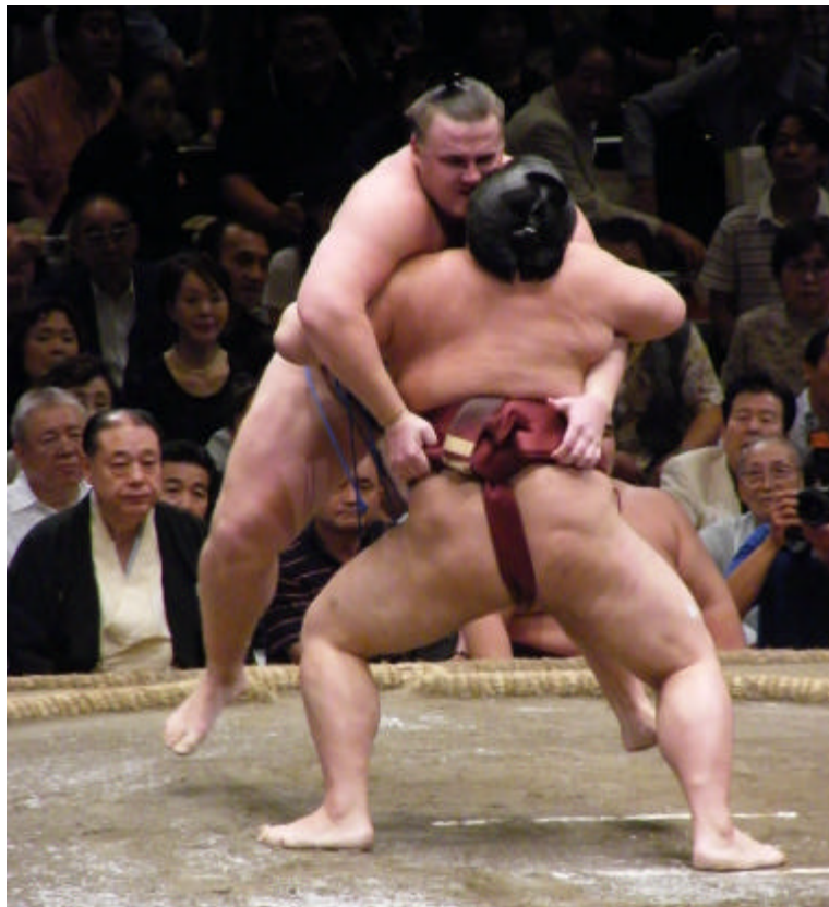
Kisenosato vs Baruto

Los acontecimientos que llevaron a "encantador" comenzaron a desarrollarse alrededor del día 4, cuando el ozeki Kaio anunció su kyujo debido a una dolorosa lesión en la pantorrilla que sufrió durante los entrenamientos anteriores al torneo y a un golpe en el codo sufrido al caer tras la aplastante derrota contra Wakanosato. Como ocurre a menudo con Kaio, cualquier kyujo induce a una nueva ronda de rumores de intai, pero ahora