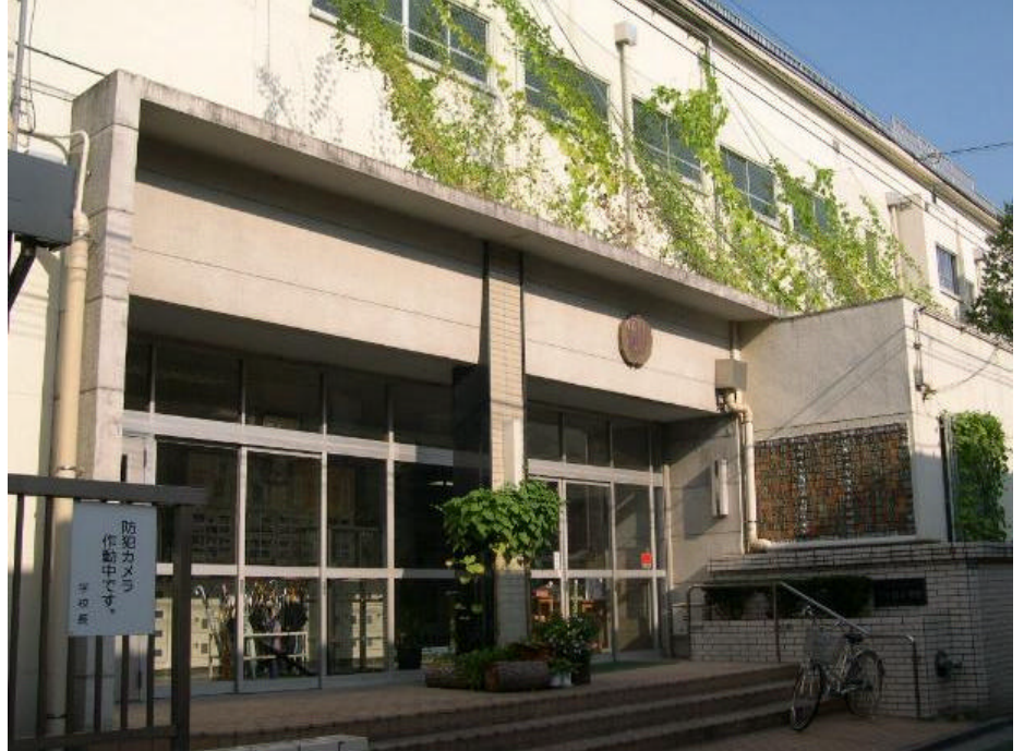
Shimo-Koiwa - a la 2007 - three quarters of a century after Tochinishiki enrolled

A pesar de que en sus últimos años llegó hasta los 140 kg, Tochinishiki empezó como un luchador ligero y delgado que apenas superaba los 80 kg. Para competir ante rivales mucho más grandes, desde el principio necesitó trabajar realmente duro para aprender una variedad de estrategias así como desarrollar una gran variedad de habilidades en el sumo. A su debido tiempo llegó a ser el último virtuoso y literalmente maestro de las técnicas de sumo.