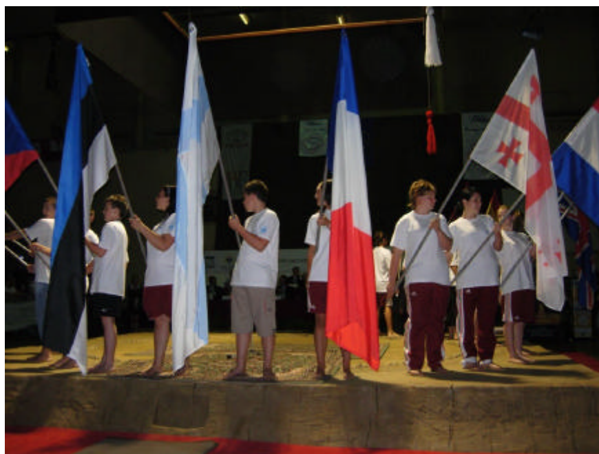
Un drapeau français aux Championnats d'Europe, enfin !

manifestation je devrais être impressionné par le professionnalisme des organisateurs... Les horaires glissent parfois un peu, mais tout est prévu et géré dans les moindres détails, et ceci avec une