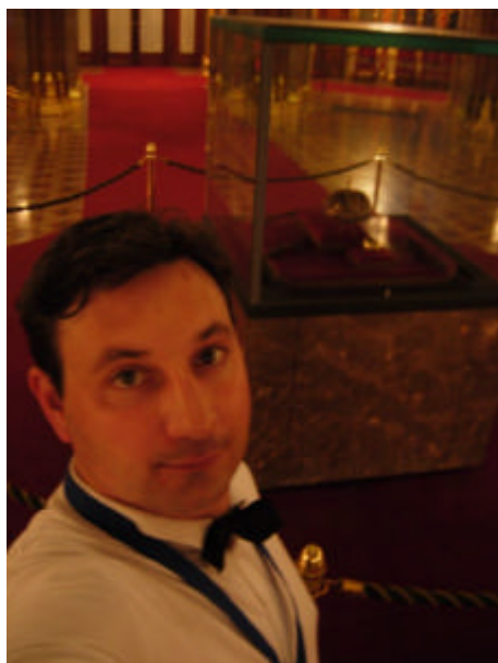
Et me voilà, Budapest !