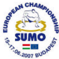
Le logo officiel des Championnats