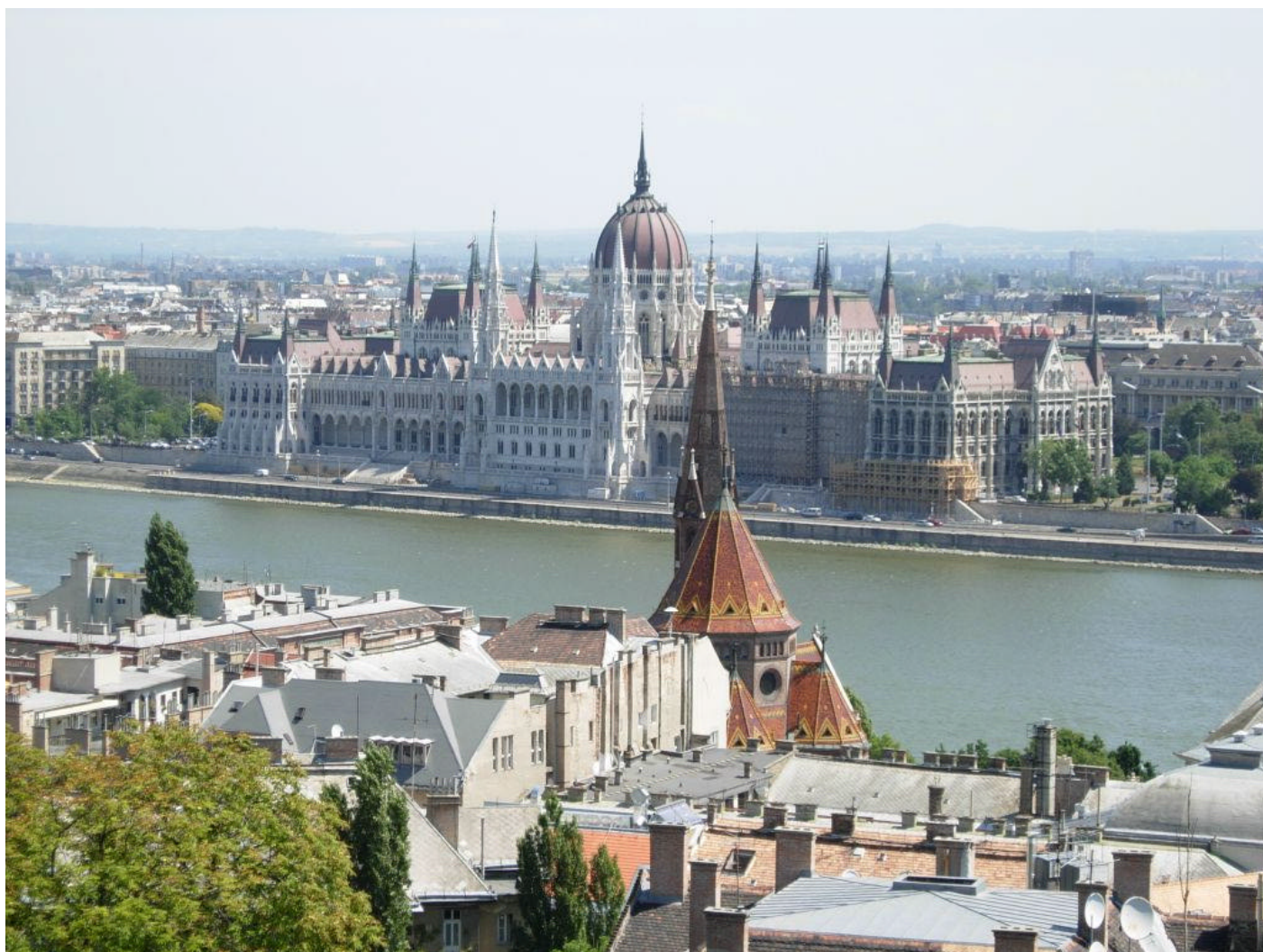
Une des villes les plus belles d'Europe...